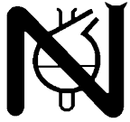
Tabelle 2.5 Proctorversuch DIN 18127